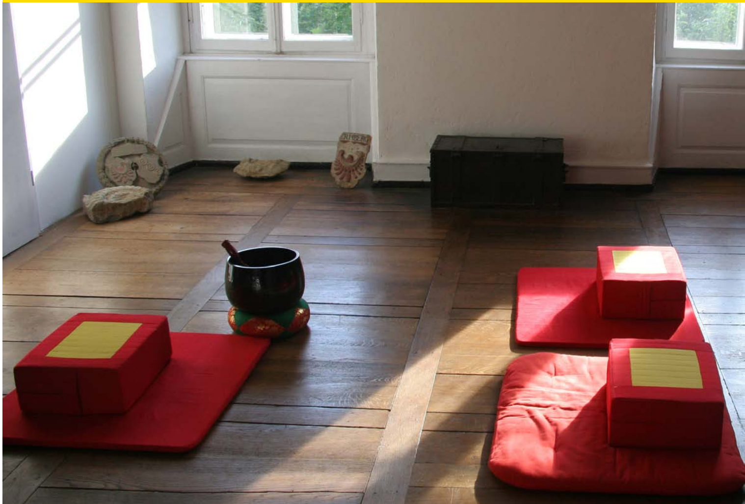
Meditationsraum im Hotel Schloss Heinsheim: Hier treffen sich Manager zur Kontemplation.